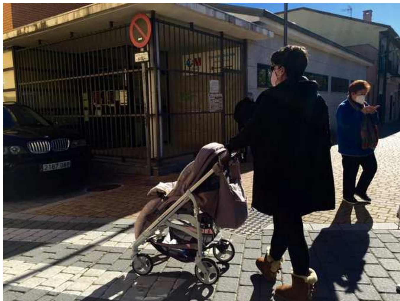
Consultorio Ernest Lluch, sin placa alguna que le recuerde, en Navalagamella (Madrid).

Cuando oye este detalle, el socialista Enrique Barón, que compartió Consejo de Ministros con Lluch, recuerda una anécdota de su amigo con los tricornios. Una mañana del verano de 1977 estaban negociando la Ley de Medidas Urgentes de Reforma Fiscal, decisiva en la Transición, y acudieron Ernest y él a una reunión en Castellana 3, que había sido sede en Madrid de la Presidencia del Gobierno en la República, después despacho de Luis Carrero Blanco , y luego, en la Transición, sede de la civepresidencia del Gobierno con Fernando Abril Martorell .